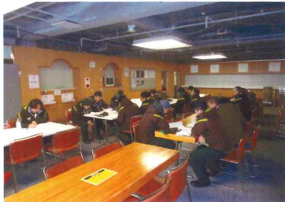
シーズン前の講習会 (研修会・講習会で使用したテキストを参照)

当社では、輸送並びにお客様の安全確保に役立つようシーズン営業開始前、索道技術管理者の指導による施設の仕様、リフト運転取扱についての安全教育の実施や、テキストを用いた講習会を実施しスキルアップに取り組んでおります。